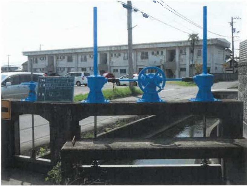
円座6号分水ゲート(本線)