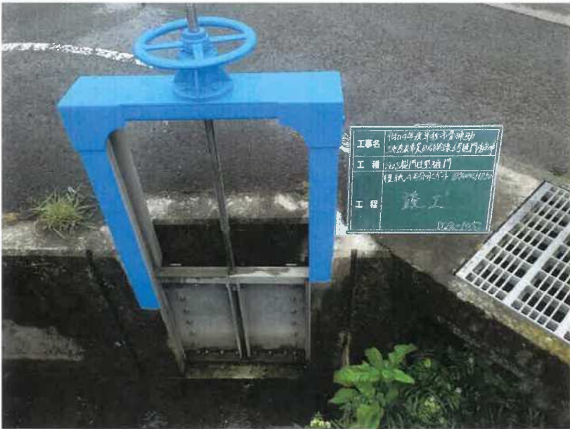
檀紙4号分水ゲート(分水)