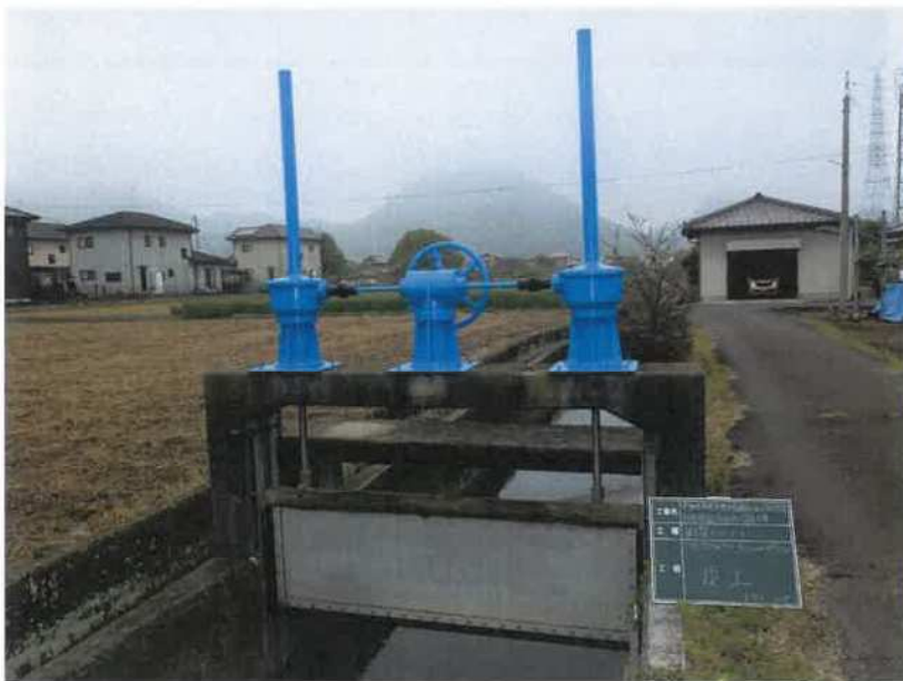
円座7号分水ゲート