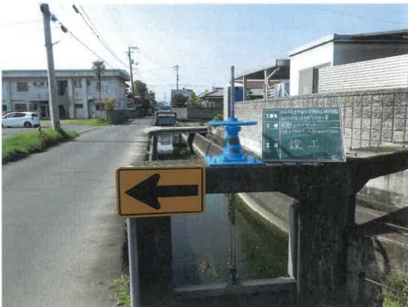
円座6号分水ゲート(分水)