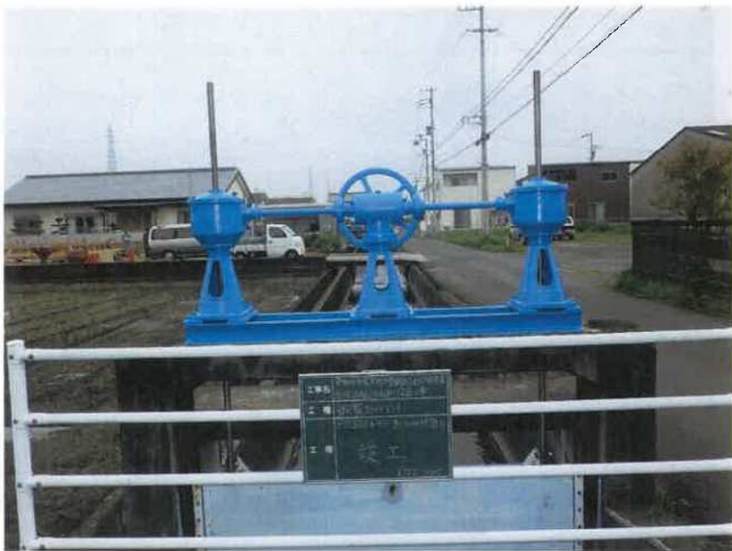
円座5号分水ゲート