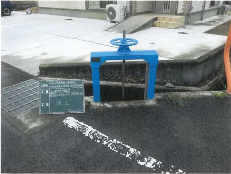
檀紙4号分水ゲート(分水)