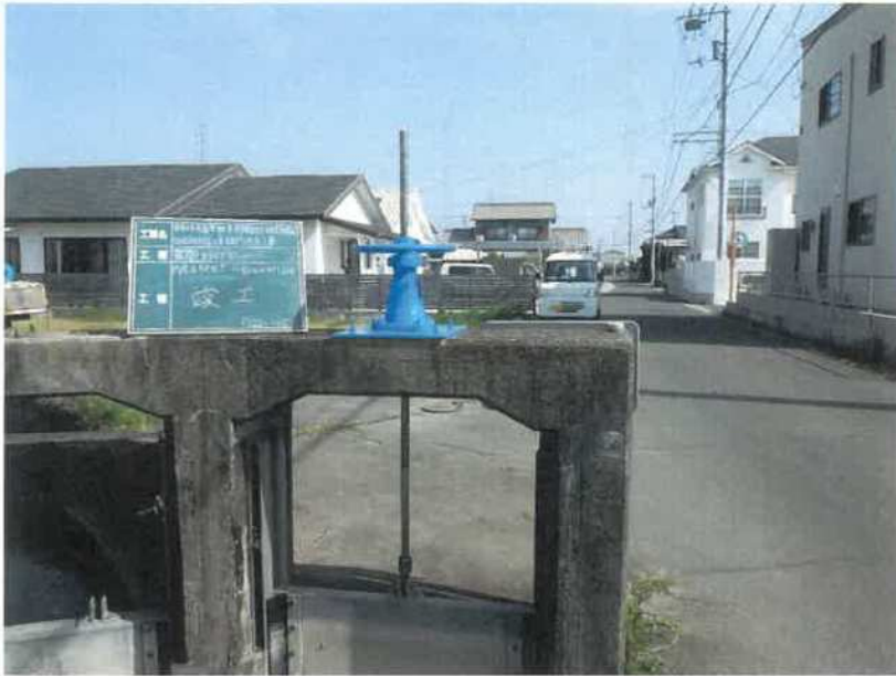
円座6号分水ゲート(分水)