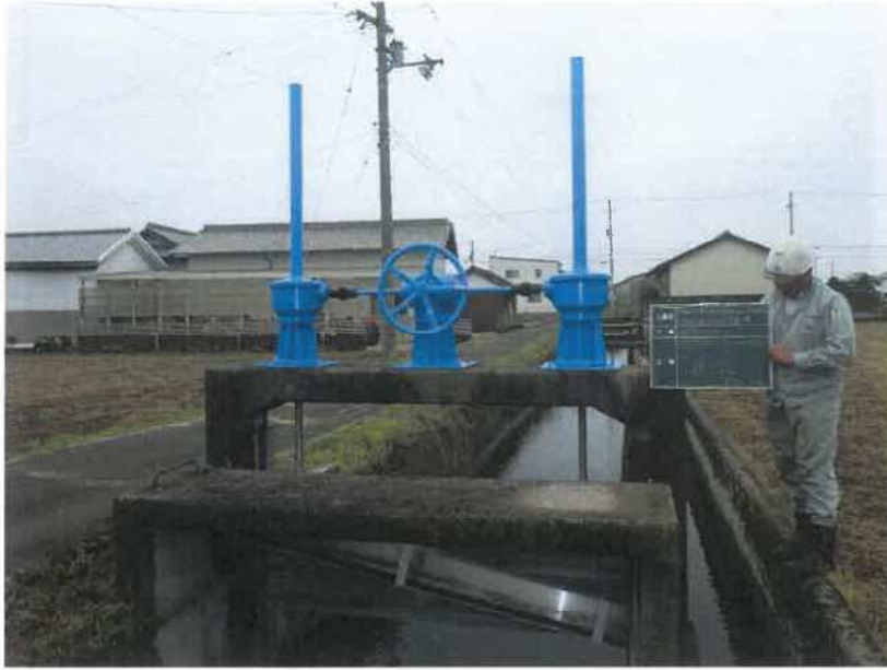
円座7号分水ゲート