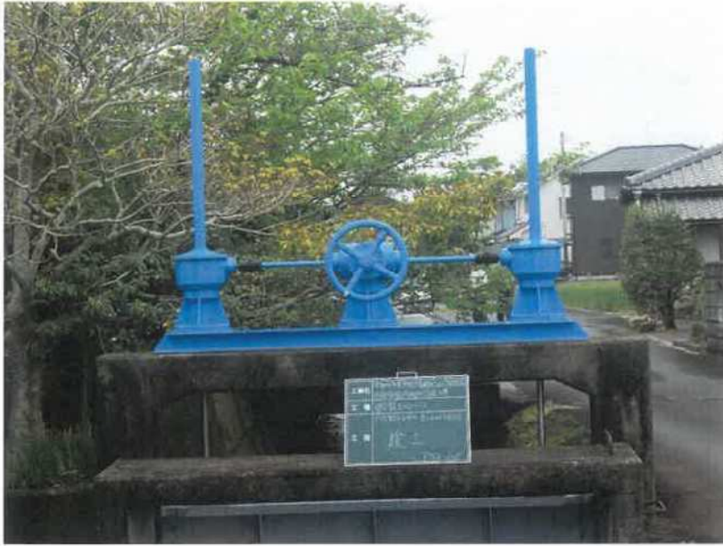
円座8号分水ゲート