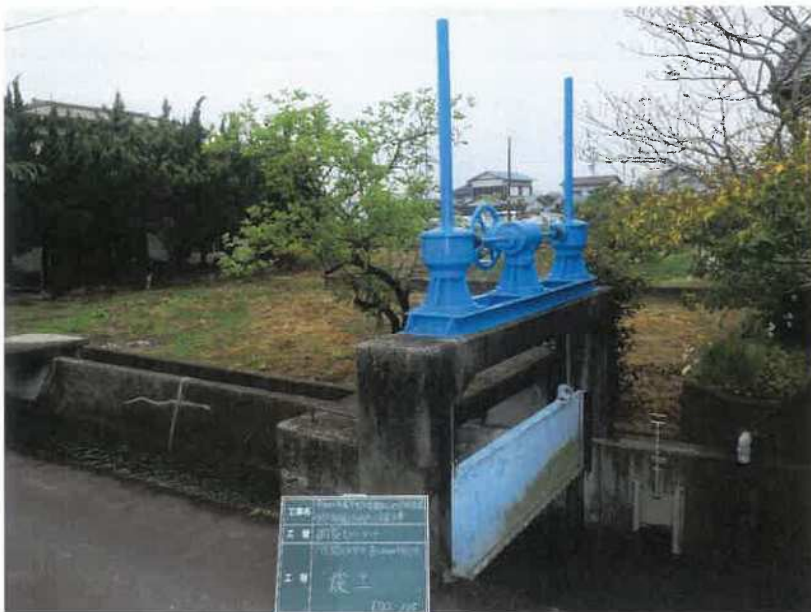
円座8号分水ゲート