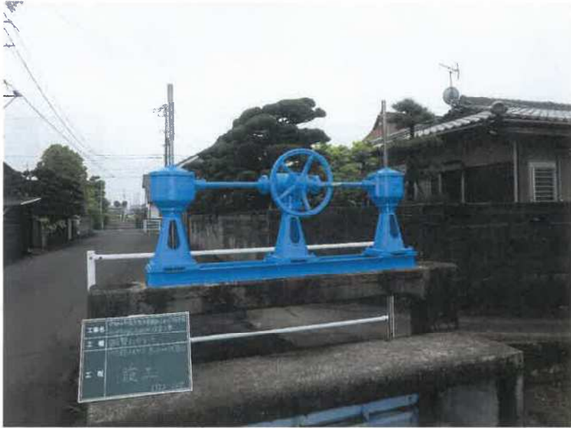
円座5号分水ゲート