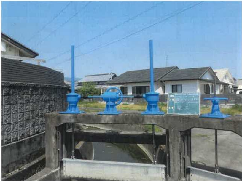
円座6号分水ゲート(本線)